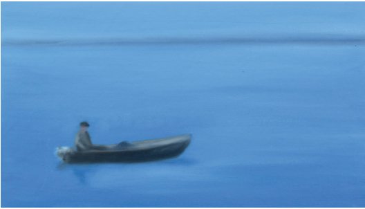
Fischer am Morgen , 2017, Öl auf Leinwand, 25 X 40 cm