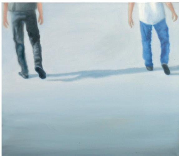
Heimweg, 2016, Öl auf Leinwand, 55 x 60 cm