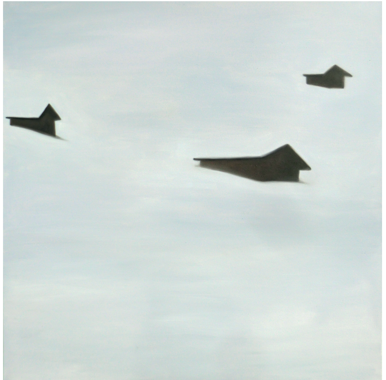
Drei Hütten im Nebel , 2016, Öl auf Leinwand, 90 x 90 cm